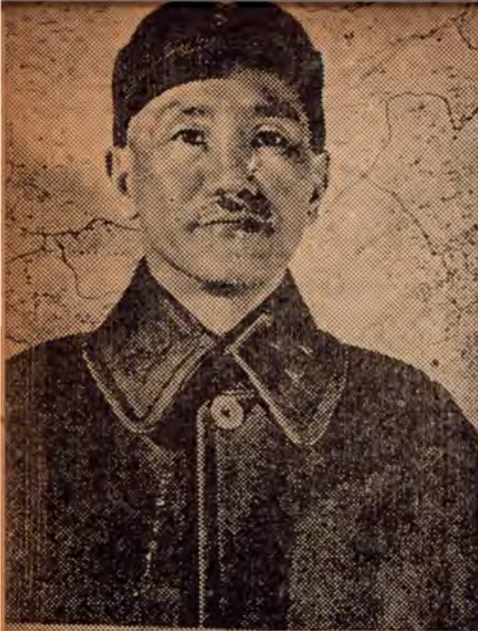
Generalísimo Chian Kai Shek